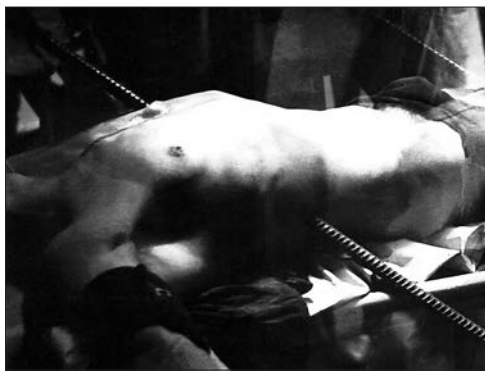
Проникающее ранение грудной клетки ломом. Красноярск, 60-е годы

Когда успел уж в двадцать лет Я в армии жениться? Нужны работа и жильё, В порту пришлось трудиться, Где общежитие дают, А вечером — учиться. Анатомический театр Тогда мы посещали, Но санитарки, вымыв пол, Туда нас не пускали. Толпу студенток я заснял И к прессе обратился, В газету «Медик» снимок дал — Вопрос и разрешился. Работа и учёба Своим шли чередом, Мужчина рухнул с крыши — Пронзил мужчину лом. Спасение чудесное В «Красрабе» описал [«Список № 1» — № 52 от 21.07.2021 года, стр. 26–27], Теперь и снимки к месту Недавно отыскал.