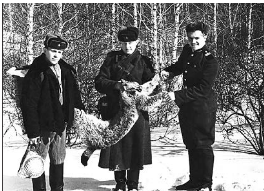
Рысь подстрелил однажды на смене часовой... Юрга Кемеровской обл., 1963 год

«Побольше тренируйся — „Мужчинкой“ надо быть!» На спусках мы скользили, А на подъём — плелись, И невдомёк нам было: Крадётся рядом рысь! Но вовремя заметил Её наш часовой,