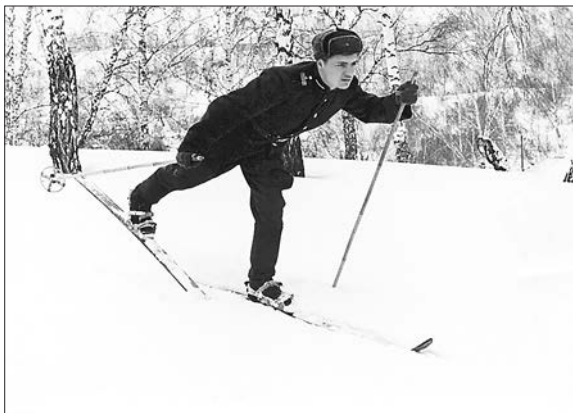
Лыжный забег. Юрга Кемеровской обл., 1963 год

«Побольше тренируйся — „Мужчинкой“ надо быть!» На спусках мы скользили, А на подъём — плелись, И невдомёк нам было: Крадётся рядом рысь! Но вовремя заметил Её наш часовой,