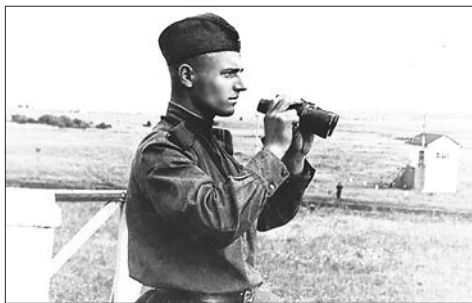
Наблюдатель на вышке. Таскино, 1961 год