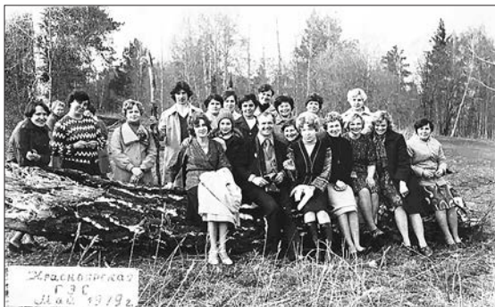
Коллектив поликлиники КраЗа на Красноярской ГЭС. 70-е годы

Коллег из поликлиники Здесь удалось заснять, Когда автобус КраЗа Привёз нас отдыхать. Водитель автоцеха На ГЭС нас доставлял, Площадку смотровую Ему я показал. Ещё с главинженером Крайфото были здесь, И от моста засняли Мы левый берег весь. Художник-груг Володя Привёл сюда «Москвич»,