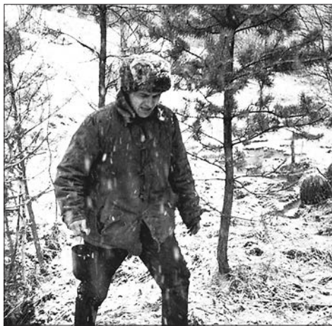
Вода для чая. Станция Бадаложная, 80-е годы

А шишек не попало — Теперь хоть в голос плачь. Вдруг встретил на опушке Могучий кедр один, Весь шишками усыпан Тот старый исполин. А рядом с исполином — Там сосенка одна, Она к нему прижалась, Как верная жена. «Ну вот, сынок, притопали, Устроим тут бивак. Пока что помоги мне Тяжёлый снять рюкзак». «А как ты, папа, с кедра Здесь шишку будешь брать?» «Придётся по сосёнке На кедр мне залезать!» Костёрчик разложили, Балуемся чайком,