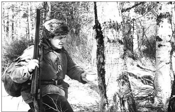
Охотничьей тропею. Берёзовый сок. Станция Бадаложная, 80-е годы

Об этом вам поведаёт Коротенький рассказ. Сошёл на Бадаложной И по лесу иду, Курки своей двустволки Уж взвёл я на беду. Болотце небольшое Попалось на пути, Его бы надо было Сторонкой обойти... Но я ружьё закинул Легонько за плечо, От рюкзака тяжёлого Спине уж горячо. И «двинул» напрямую — Чего в тайге блудить? Да позабыл для верности Двустволку разрядить. По кочкам ловко прыгал, Всем комарам назло, Случайный выстрел грянул — Мне крупно повезло!