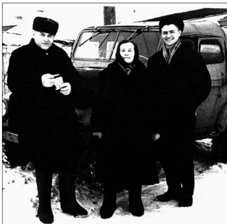
С родителями (шофёр руководителя полётов Красноярского аэропорта). Красноярск, ноябрь 1963 года