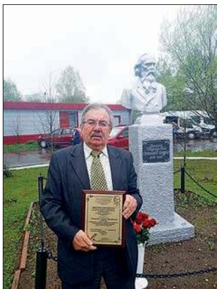
После вручения премии им. М. Е. Салтыкова-Ще- дрина. 2023