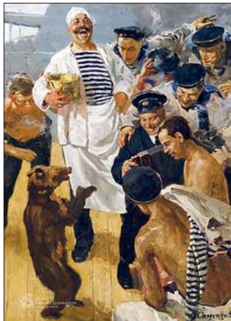
Корабельный друг. 1987