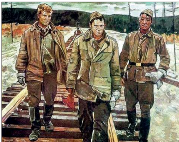
Утро БАМа. 1984