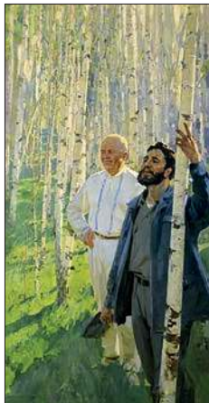
Н. С. Хрущёв и Ф. Кастро в берёзовой роще. 1963—1964