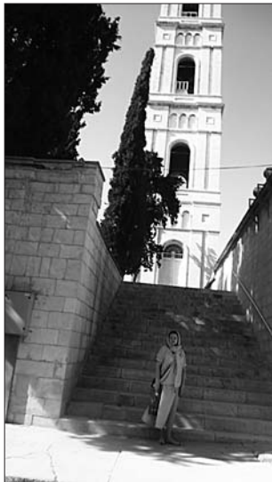
У «Русской свечи»

Христа, в первую очередь в храме Воскресения Господня прикоснулись к камню помазания, поклонились Гробу Господню и святой Голгофе, побывали на ночной Божественной литургии, исповедались и причастились на Голгофе. Служба окончилась в четыре часа утра, но усталости у нас не было. Каждый год мы смотрели по телевизору, как в этом храме на Пасху снисходит Благодатный Огонь. И вот — о чудо! — мы здесь, на этом самом месте. И верится, и не верится.