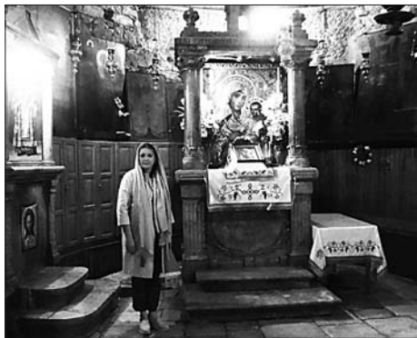
В гробнице Богородицы

В Иерусалиме у нас были очень интересные экскурсии: мы посетили святые места, связанные с земной жизнью Иисуса