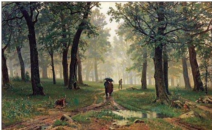
Дождь в дубовом лесу. 1891