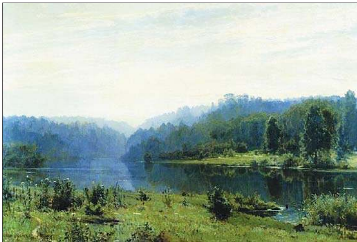
Туманное утро. 1885