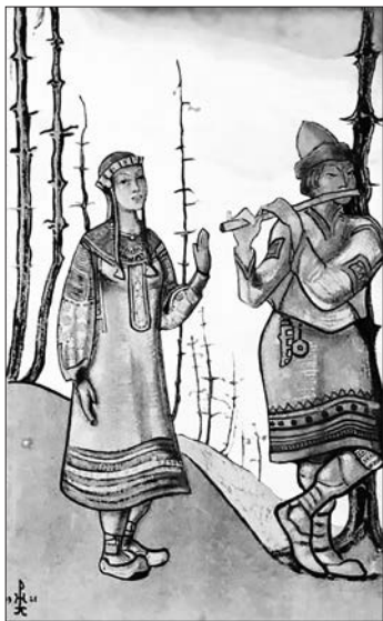
Снегурочка и Лель. 1921

Автор идеи и инициатор Пакта Рериха, основатель международных культурных движений «Мир через культуру» и «Знамя Мира». Кавалер нескольких российских и иностранных наград. В российский период жизни и творчества занимался археологией, коллекционированием, как художник успешно выставлялся, участвовал в проектировании и росписи церквей, работал директором школы Императорского общества поощрения художеств, возглавлял художественное объединение «Мир искусства», успешно работал как сценограф («Русские сезоны»), активно участвовал в проектах по защите и возрождению русской старины, в деятельности благотворительных организаций. С 1917 года жил в эмиграции. Организовал и участвовал в Центрально-Азиатской и Маньчжурской экспедициях, много путешествовал. Основал Институт Гималайских исследований «Урусвати» и более 10 культурных и образовательных учреждений и обществ в различных странах. Вёл активную общественную деятельность, был связан с политическими и экономическими проектами, имел связи с большевиками и масонством. Состоял членом многих организаций. Был женат на Елене Рерих. Имел двоих сыновей — Юрия и Святослава. С 1920-х годов в разных странах мира существуют общества и музеи Рериха. Сообщества последователей его идей и религиозно-философского учения Живой Этики (Агни-йоги) формируют рериховское движение. Идеи Рериха оказали значительное влияние на формирование и развитие нью-эйджа в России.