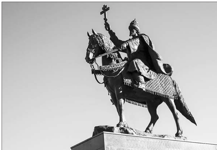
Памятник Ивану Грозному в Орле

В городе Любимове Ярославской области возникла идея возвести первый памятник Ивану Грозному. История решения этого вопроса плачевна. В 2005 году местные власти уже готовы были реализовать проектный план и утвердить расходы, но в дело вмешался архиепископ Ярославской области. Он обратился к прокурору и федеральной инспекции с просьбой помешать возведению памятника, поскольку образ Ивана Грозного ассоциируется у жителей с агрессией и жёсткостью и может повлиять на усугубление криминогенной ситуации. Почему жители небольшого городка, созерцая первого русского царя, будут больше