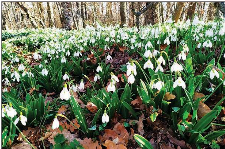
8 марта на Аю-Даге (Медведь-горе)