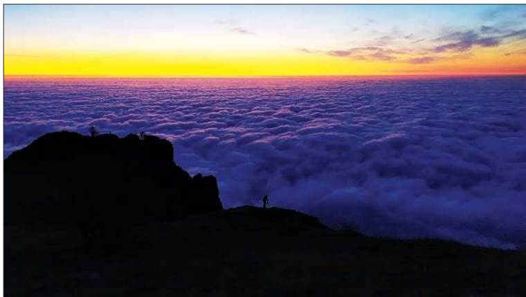
Предрассветная тишь на горе Демерджи