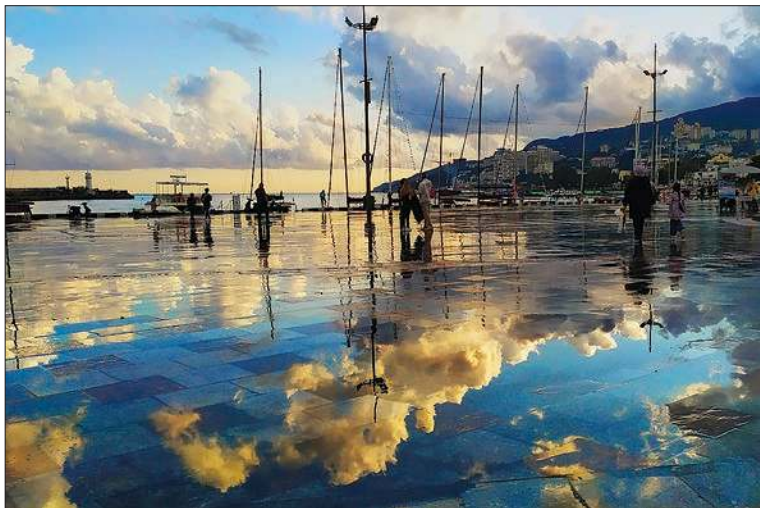
Зеркальный закат на набережной Ялты