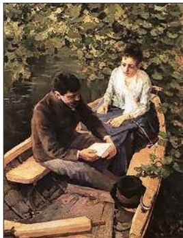
В лодке. 1888