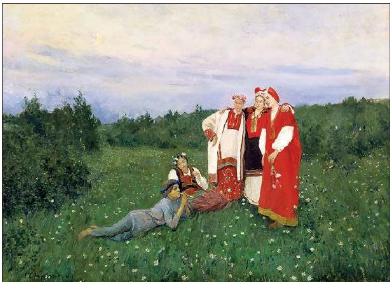
Северная идиллия. 1886