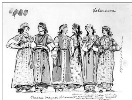
Сенные девушки Хованского. 1910