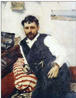
В. Серов. Портрет К. Коровина. 1891