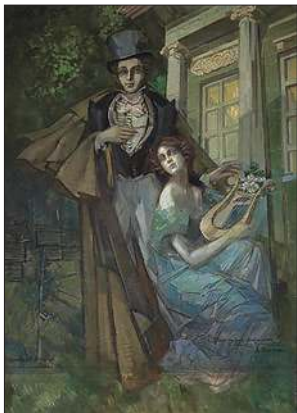
Пушкин и муза. 1930