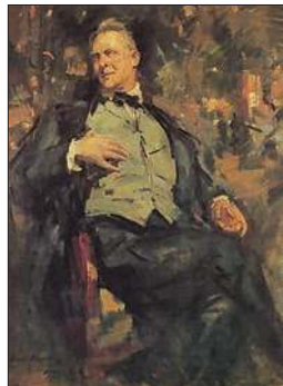
Портрет Ф. И. Шаляпина. 1921