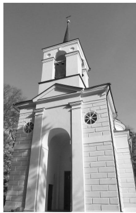
Церковь усадьбы в стиле неоготики