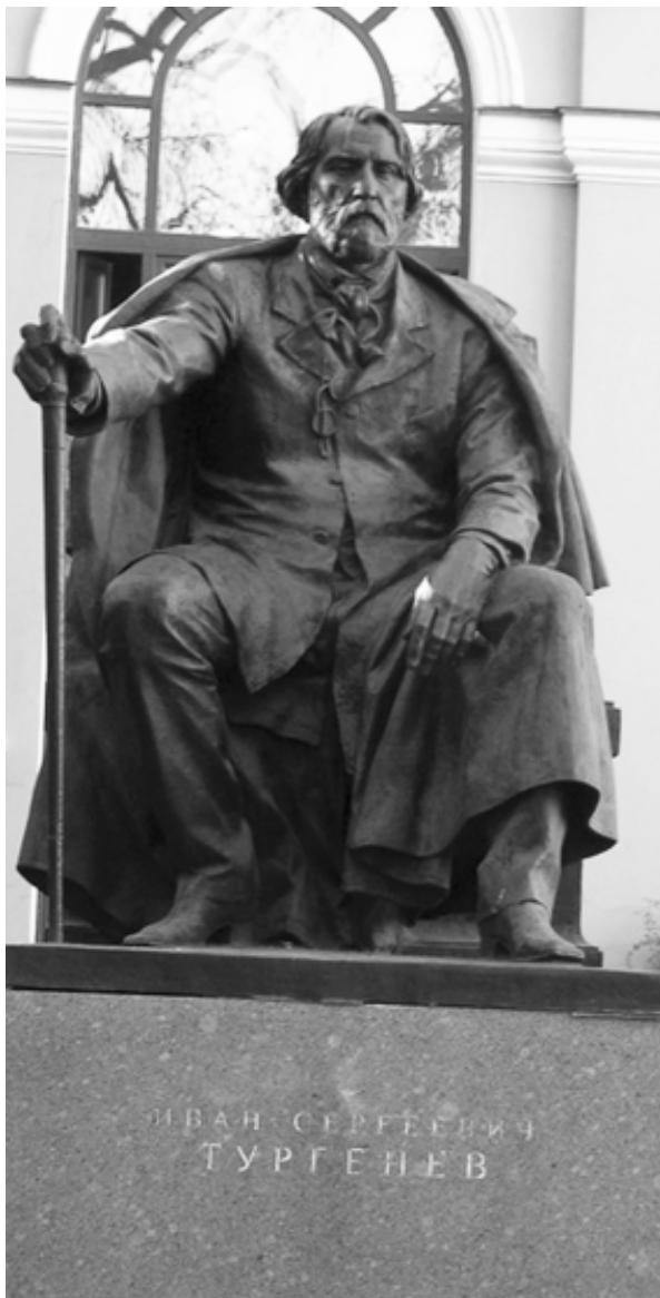
Памятник Тургеневу в Санкт-Петербурге