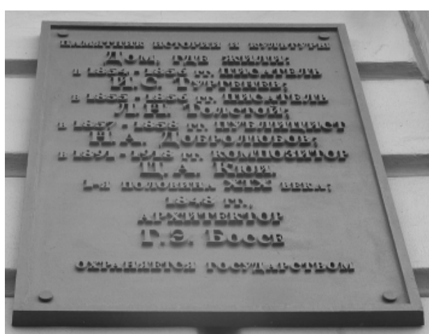
Памятная доска в Санкт-Петербурге (наб. Фонтанки, дом 38)