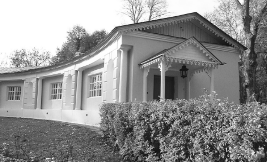
Флигели барского дома