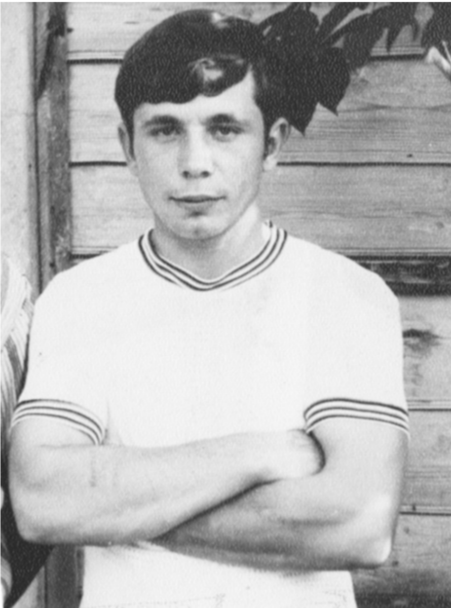
Готов к бою...