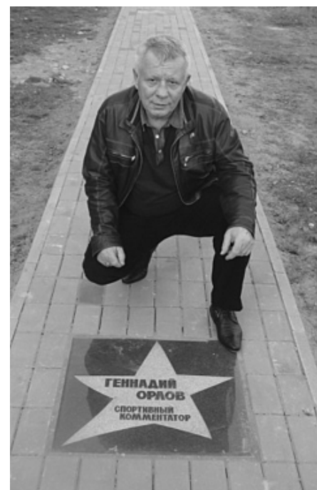
На Аллее славы