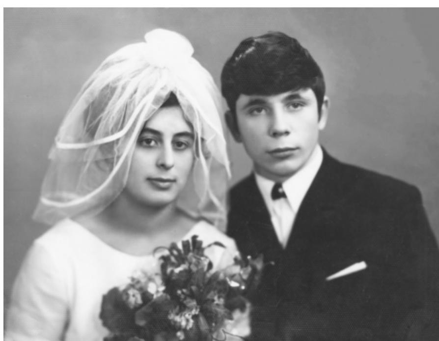
31.12.1969 г. Первая любовь. Это моё первое испытание, я его не выдержал, потом были снова... Я прошу у всех прощения.