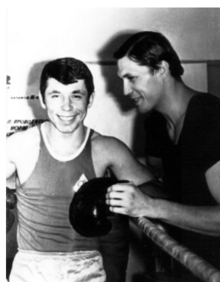
1972 г. Московский городской стадион «Динамо». После боя...