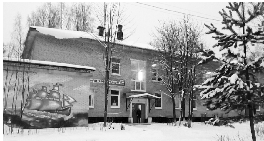
Дом детского творчества