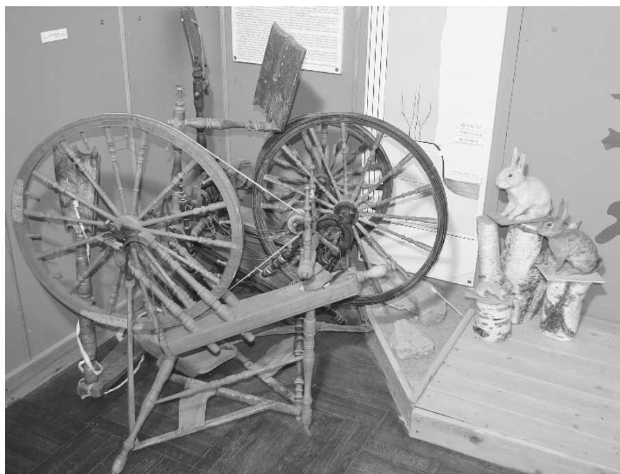
В школьном музее

Так удивительно пересекается русская природа Новгородчины и своеобразная красота ингерманландского края с болотина-