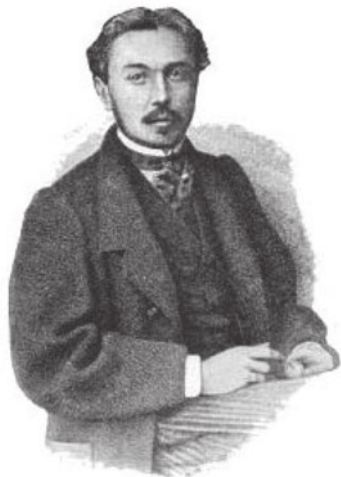
Всеволод Владимирович Крестовский

Для рядового читателя и телезрителя В. Крестовский предстает как мастер исторического детектива. Вроде бы как предшественник Бориса Акунина-Чхартишвили, хотя последний