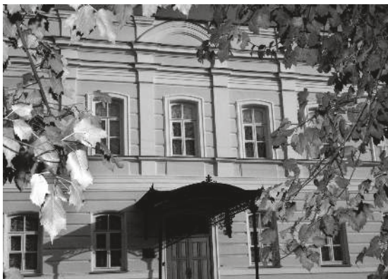
Дом-Музей М. Цветаевой в Москве