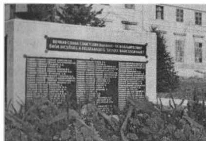
Памятник погибшим солдатам и офицерам 3 Гв. ВДД в Венгрии севернее озера Балатон на месте боёв. Снимок 1974 года.

В конце войны очень многие стали более боязливыми. Сознательно (или подсознательно) преследовала мысль – вот война кончается, и вдруг меня убьют в последние недели. Обидно. Мне кажется, что похожие мысли были и у противника. Во всяком случае, в Западной Венгрии и в Австрии на нашем участке фронта с середины апреля война имела символический характер.