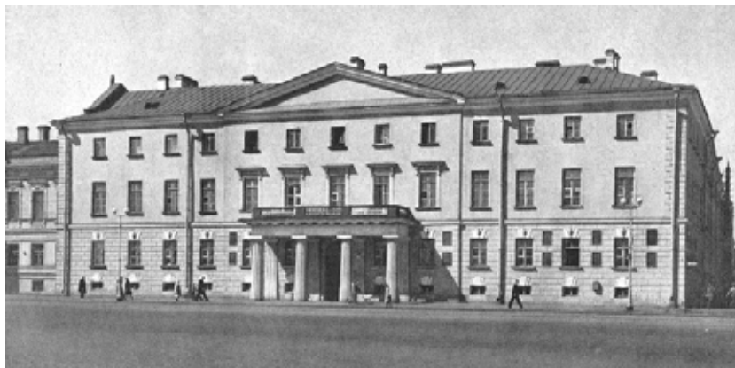
«Дом академиков» в Ленинграде, где жила семья Вернадских до переезда в Москву

В Петроград Вернадские приехали в первых числах апреля 1921 г., вновь поселились на Васильевском острове, в «доме академиков» (7-я линия, д. 2). В.И. Вернадский активно включился в научную и организационную работу. 23 апреля 1921 г. он официаль-