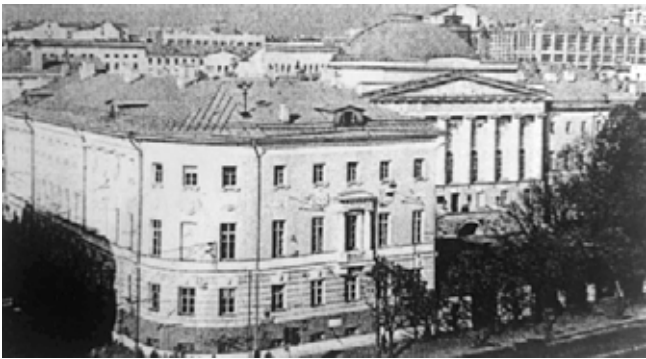
Здание Московского университета на Моховой улице

в Петербургском университете, а в 1897 г. там же защищает докторскую диссертацию. С 1898 г. — экстраординарный профессор, с 1902 г. — ординарный профессор Московского университета.