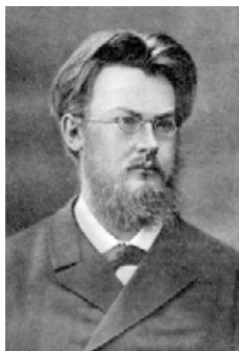
В.И. Вернадский в студенческие годы