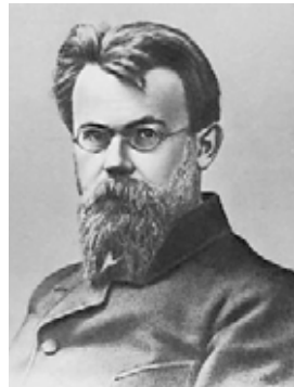
В.И. Вернадский — профессор Московского университета

Конституционно-демократическая партия России объединила в своём составе цвет российской либеральной интеллигенции на-