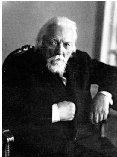
Президент Российской Академии наук и Академии наук СССР академик А. П. Карпинский (1917–1936)

и начало 1937 гг. приходились четыре круглые даты, касающиеся А.П. Карпинского: 90 лет со дня рождения, 70 лет его научной деятельности, 50 лет со времени избрания академиком, 20 лет пребывания в должности президента Академии наук. Предполагалось отметить все даты вместе в январе 1937 г. Однако активную деятельность А.П. Карпинского в Москве прервала тяжёлая болезнь. 19 июня он почувствовал первые признаки заболевания и, несмотря на все усилия столичных врачей, скончался 15 июля