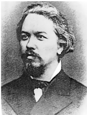
А.П. Карпинский. 1870-е годы

Непосредственные контакты с представителями власти начались в марте–апреле 1918 г. со встречи С.Ф. Ольденбурга с секретарём Совнаркома Н.П. Горбуновым (1892–1938), личным