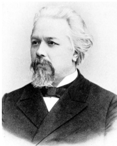
Академик А.П. Карпинский в начале XX века

12 апреля 1918 г. Совнарком РСФСР принял постановление о финансировании научных работ Академии наук. В 1919 г. вместо