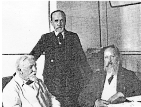
Слева направо: президент АН СССР А.П. Карпинский, непрременный секретарь С.Ф. Ольденбург и вице-президент В.А. Стеклов. 1925 г.

27 января 1921 г. В.И. Ленин в присутствии М. Горького принял вице-президента Академии наук В.А. Стеклова и С.Ф. Ольденбурга. В продолжительной беседе был обсуждён широкий круг вопросов. В заключение встречи В.И. Ленин сказал: «Я лично глубоко интересуюсь наукой и придаю ей громадное значение. Когда вам что-нибудь нужно будет, обращайтесь прямо ко мне» [4].