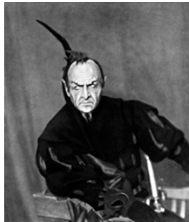
Ф.И. Шаляпин в роли Мефистофеля.