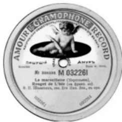
Грампластинка фирмы «Пишущий амур» с записью «Марсельезы» в исполнении Ф.И. Шаляпина

Вернёмся к программе спектакля о Народном артисте мира. Счастливым обстоятельством можно считать желание авторов показать не только творческие успехи современных певцов, но и непреходящую красоту оперы. Как драгоценные камни одного ожерелья перед слушателями проходят сцены (костюмированные!) опер Римского-Корсакова («Садко»), Чайковского («Евгений Онегин»), Глинки («Жизнь за царя»), Даргомыжского («Русалка»), Рубинштейна («Демон»), Муссорского («Борис Годунов»), Бородина («Князь Игорь»), Массне («Дон Кихот»), Верди («Дон Карлос») и Россини («Севильский цирюльник»). Даже появление среди невольниц