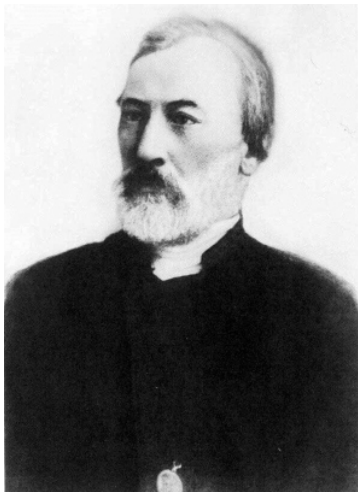
Константин Николаевич Леонтьев

В 1870 году умер А.И. Герцен, знаменитый «колокол революции», над которым Лесков иронизировал, впрочем, отчасти уважая его. В это же время в 1871–72 гг. выходят в журнале «Русский вестник», издававшемся М.Н. Катковым и К.Н. Леонтьевым, «Бесы» Достоевского, где абсолютно недвусмысленно звучат прогнозы о грядущей революции. Почти одновременно в этом журнале публикуется и роман Н.С. Лескова «На ножжах». Несмотря на то, что оба романа — «Бесы» Достоевского и «На ножжах» Н.С. Лескова — были объявлены