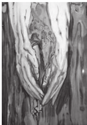
С. Дали. В руках Антея

Особенно удались художнику иллюстрации к первой части трилогии «Ад».