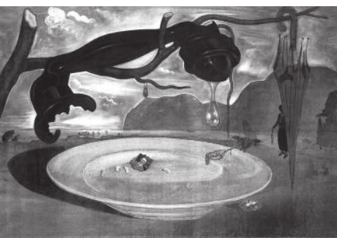
С. Дали. Загадка Гитлера