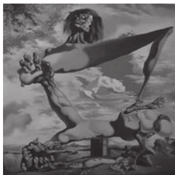
С. Дали. Предчувствие гражданской войны

...И вот, я вхожу в дворец Белосельских-Белозерских на Фонтанке, в котором не так давно был открыт музей Фаберже. Фаберже и Сальвадор Дали? Что их связывает? Пасхальные яйца Фаберже и яйцо на картине «геополитический мальчик...»? Это и есть высокое искусство, преодолевающее века, годы и расстояния.