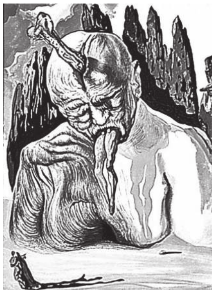
С. Дали. Илл. к трилогии «Ад»