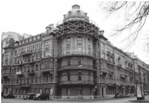
Башня Вячеслава Иванова на Таврической ул.