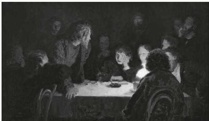
Илья Репин. При свете лампы