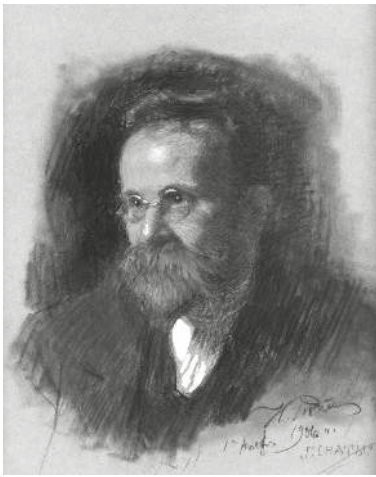
Илья Репин. Портрет Н.А. Морозова

что интересно: в «мёртвом доме» ему разрешили работать! Он тут же схитрил, попросив устроиться переплётчиком, получив доступ к университетским лекциям. Также к другим научным трудам. Читал, переплетал, размышлял, сочинял. Времени было предостаточно. И достиг огромных высот в области математики, химии, астрономии, физики (астро-, геофизики тоже), языковедения (знал 11 языков), истории, метеорологии etc.