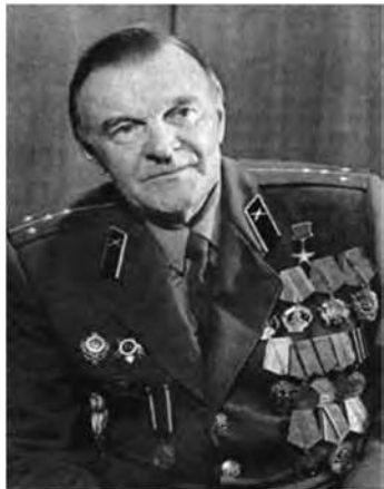
Юрий Васильевич Бондарев

от не были для Бондарева пустым звуком. Он громил диссидентствующих Солженицына и Сахарова, 31 августа 1973 года подписывая письмо в редакцию газеты «Правда», в тексте которого присутствовали следующие строчки: