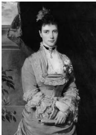
Императрица Мария Фёдоровна, супруга Александра III

В ведении РОКК и ходило большинство Общин сестёр милосердия. В 1880–1917 гг. РОКК возглавлял императрица Мария Фёдоровна, супруга Александра III.