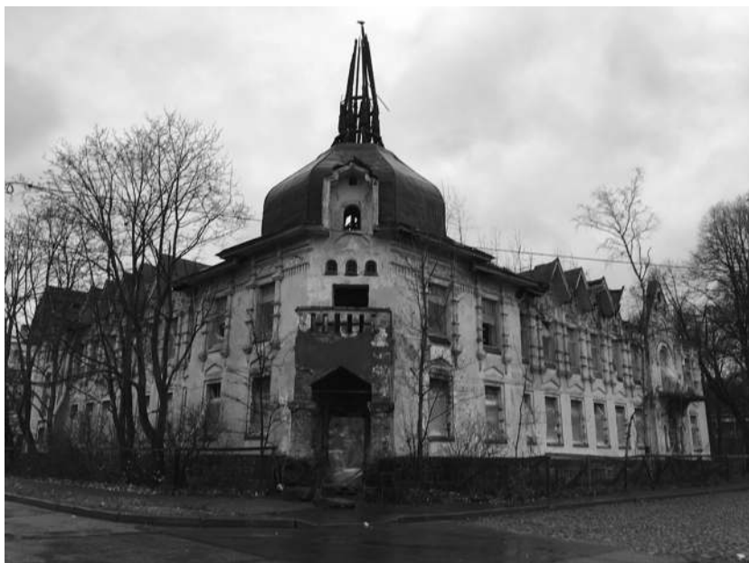
Дом общины сестёр милосердия Кронштадтского морского госпиталя. Кронштадт. Улиц Пролетарская, дом 30. 2017 г.

После войны морская община оказалась в бедственном положении, так как консул приступил к самостоятельной деятельности в 1903 г., а в 1904 г. начался русско-японский конфликт, на которую ушли все первоначальные средства общины. Кронштадтская морская община ещё не имелась своего капитала, в отличие от дру-