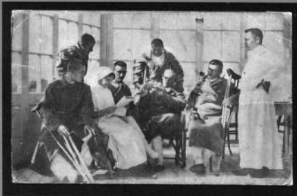
Въ тыловомъ госпиталь. Вѣсти съ войны. Изд. Д. Хромовъ и М. Бахрахъ, Москва. №252 Доз. воен. цензурой. Перепечатка будет преслѣдоваться.