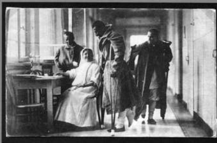
Въ тыловомъ госпиталь. ... а какъ бросишься на нихъ въ штыки, только крикъ услышать и бѣгутъ, пятки лишь сверкаютъ... (Изъ разсказа раненаго).

Изд. Д. Хромовъ и М. Бахрахъ, Москва. №253 Перепечатка будет преслѣдоваться.