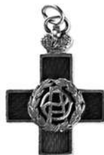
Знак Крестовоздвиженской общины сестёр милосердия

Община состояла в ведении Кронштадтского крепостного комитета Крестовоздвиженской общины и полностью от него зависела. Коми-