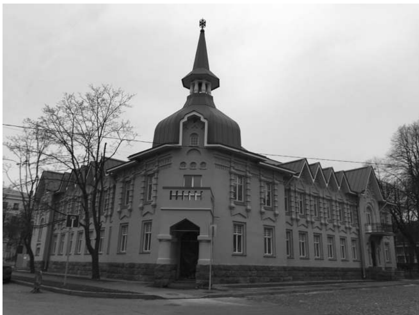
Гостиниц «Ус дьб дмир л Л з рев». Кроншт дт. Улиц Пролет рск я, дом 30. 2021 г.

Сёстры милосердия ком ндиров лись в госуд рственные и ч стные учреждения — больницы, л з реты, лечебницы, т к же ок зыв ли медицинскую помощь ч стным лиц м н дому. Де-