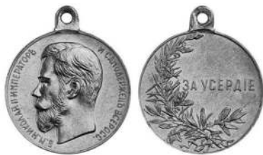
Медаль «За усердие»

На крейсере «Аврор» перед уходом на Дальний восток из морского госпиталя в Кронштадте был взят рентгеноппарат. 19 мая 1905 года после Цусимского сражения старший врач крейсера