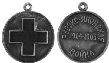
Медаль Красного Креста «За войну»