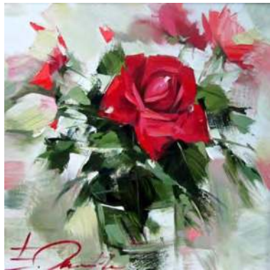
работа Евгении Октябрь

показаться, что это довольно поздно для человека, родившегося в творческой семье (мой папа – известный художник Валерий Октябрь , мама – искусствовед и педагог), но, на самом деле,