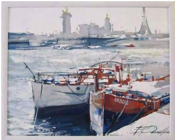
работа Евгении Октябрь

обучали, а из-за моих личных особенностей. Мне как человеку, отвергающему условности, не терпящему, когда подгоняют под какие-то рамки, было невыносимым следовать строго упорядоченному темпоритму занятий. Кроме того, многое из того, что преподавали в Университете, казалось мне, художнику, не просто безынтересным, но и лишним. Например, политология. Или усиленная муштровка по английскому языку. Впрочем, должна признать, что университетское знание английского очень пригодилось мне впоследствии, когда я поехала в Европу.