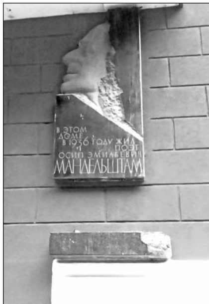
Мемориальная доска и памятник О. Мандельштаму