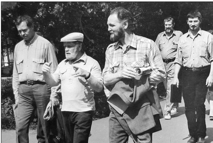
В.Г. Распутин, В.И. Белов, В.Н. Крупин, Д.А. Жуков, В.М. Клыков в В. Новгороде. 1988 г.