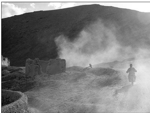
В окрестностях Заранджа

Когда начала реализовываться политика национального примирения, то все поставленные задачи: заключить договоры с бандами, свести враждебные настроения к минимуму, — выполняли. Оказывали гуманитарную помощь населению. Правда, привозили в качестве гуманитарки всякую мелочь: галоши, которые никому не нужны — только три дня в году шел дождь; посуду, одежду. Вещи хранились у нас, чтобы их партийные функционеры быстро не разбазарили, и хоть что-то дошло до простого народа.