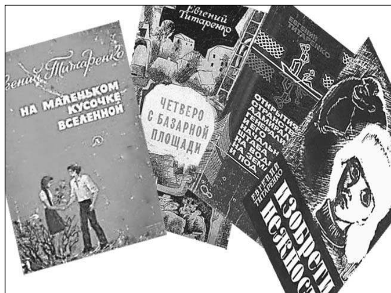
Этими книгами зачитывались не только подростки