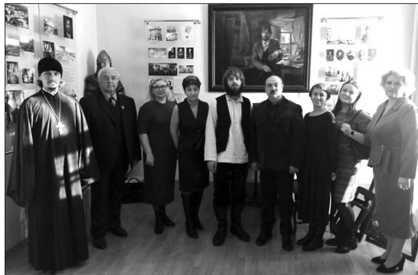
Открытие новой экспозиции об А.П. Рябушкине

Процесс мемориализации — это непростое долговременное действие, требую-