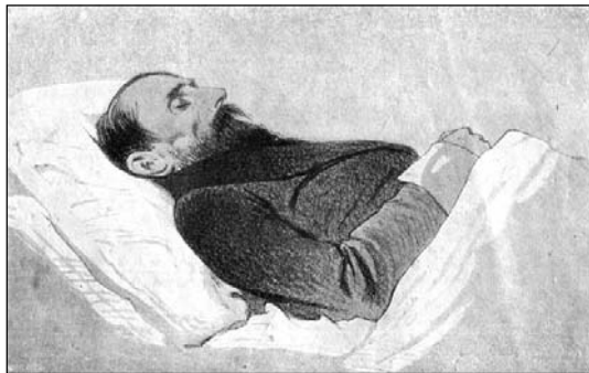
7. И.С. Никитин на смертном одре. Рисунок. Художник С.П. Павлов, Воронеж, 1861 г. С хромолитографии В.Ф. Тимма, 1862 г., «Русский Художественный Листок», № 32. Иллюстрация из книги.

лицом был подарен портрет И.С. Никитина неизвестного мастера. В 1974 году в газете «Коммуна» на этот счет выйдет обстоятельная статья искусствоведа Николая Соседко.