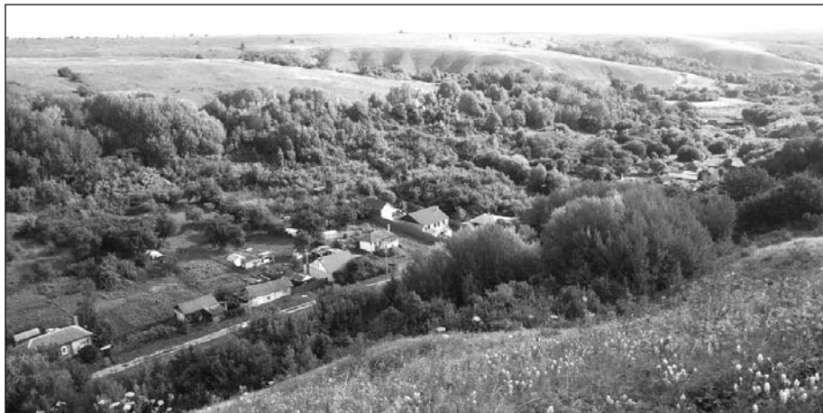
Костёнки. Углянка. Современный вид

Следует упомянуть и разные тюркско-монгольские народы, как волны сменявшие друг друга на протяжении времен: хазары, печенеги, половцы, монголы побывали здесь. Все тот же Болховитинов поведал и еще одно предание, объяснявшее происхождение костей. На этот раз вместо скифов оказалась монгольская армия под командованием внука великого Чингисхана (1162–1227) Бату-хана (1205–1255), известного по древнерусским летописям под именем Батыя. Болховитинов сообщал: «...но, кажется, не нужно так далеко возводить происхождение сих слоновых костей. Разогнем российские летописи и в них увидим гораздо достовернейшую и новейшую эпоху сих костей под 1237 годом, в котором описывается при Воронеже бывшее кровопролитнейшее и роковое для всей России сражение российских князей с татарским ханом Батыем, шедшим с войсками в сии места, и по обычаю древних азиатских армий ведшим за собою, конечно, и сло-