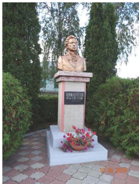
Становое, Липецкая область

В Пальне — Михайловке во дворе школы установлен памятник Пушкину. Стаховичи в парке своего имения еще в 19 веке установили один из первых памятников Пушкину. В начале 21 века в здании усадьбы открыт музей Стаховичей. После 2010 года в России установлены новые памятники И.А. Бунину: в Орле, Белгороде, Ефремове, Васильевке (Липецкая область) и за рубежом — Грасс (Франция). Память о великих поэтах неизгладима.