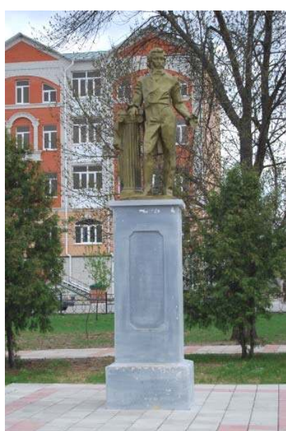
Елец, Липецкая область