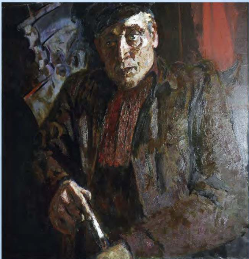
А. Рубцов. Человек с тростью. Х. м., 1981 г.