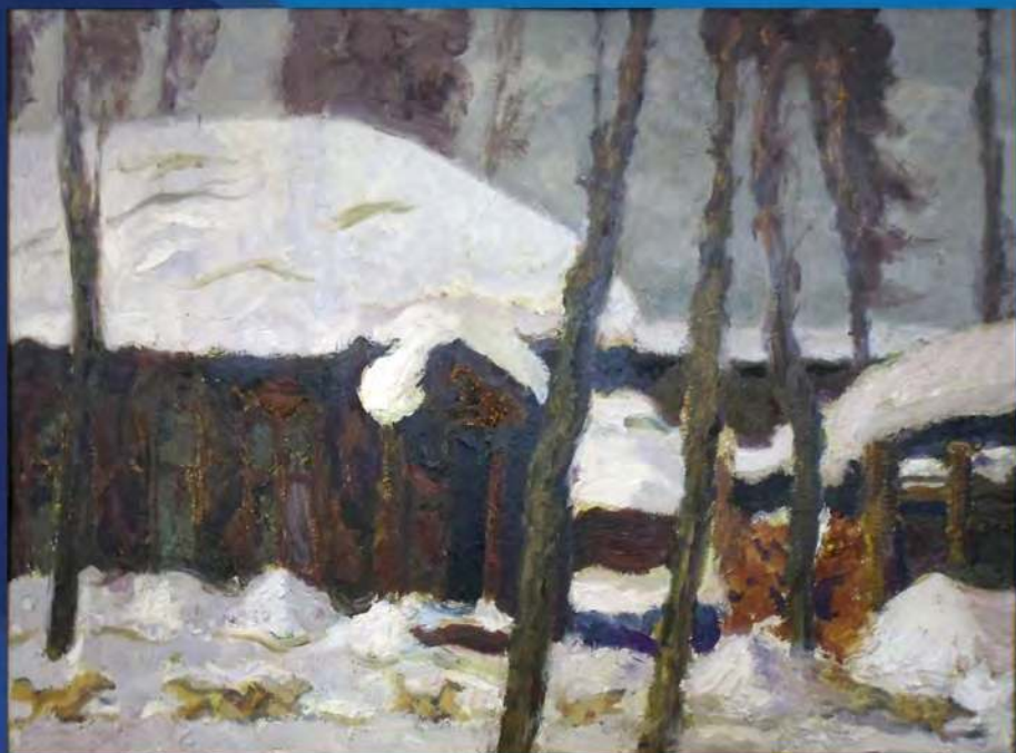
А. Рубцов. Зимний день. Х., м. 1984 г.