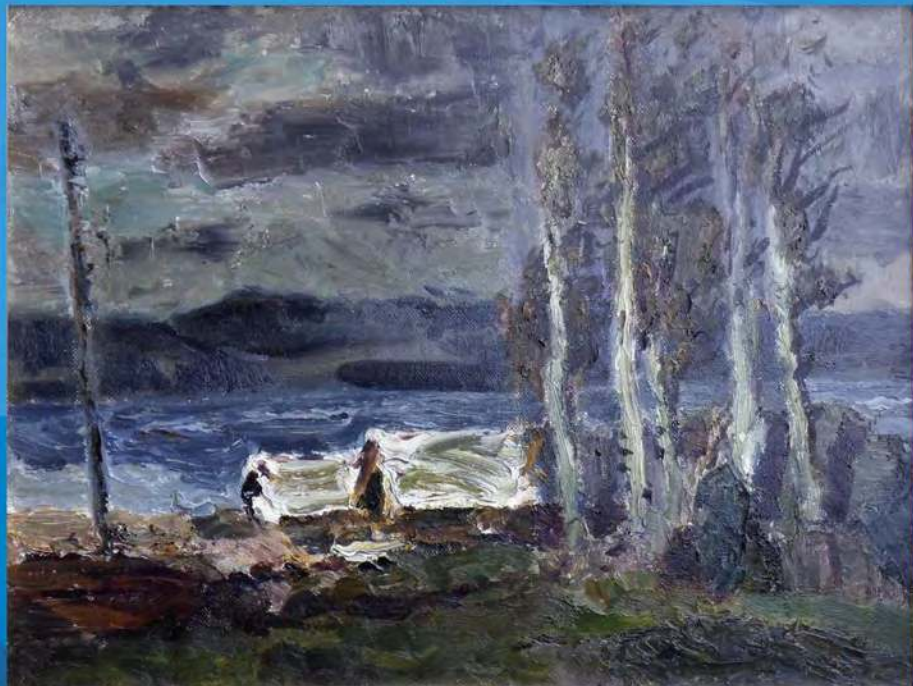
А. Рубцов. Ветреный день на Ангаре. Х., м. 1988 г.