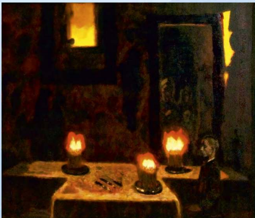
А. Рубцов. Притча о мальчике. Х., м., 1980 г.