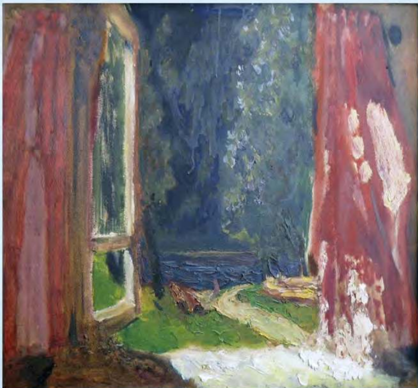
А. Рубцов. Окно на реку, Х., м., 1990 г.