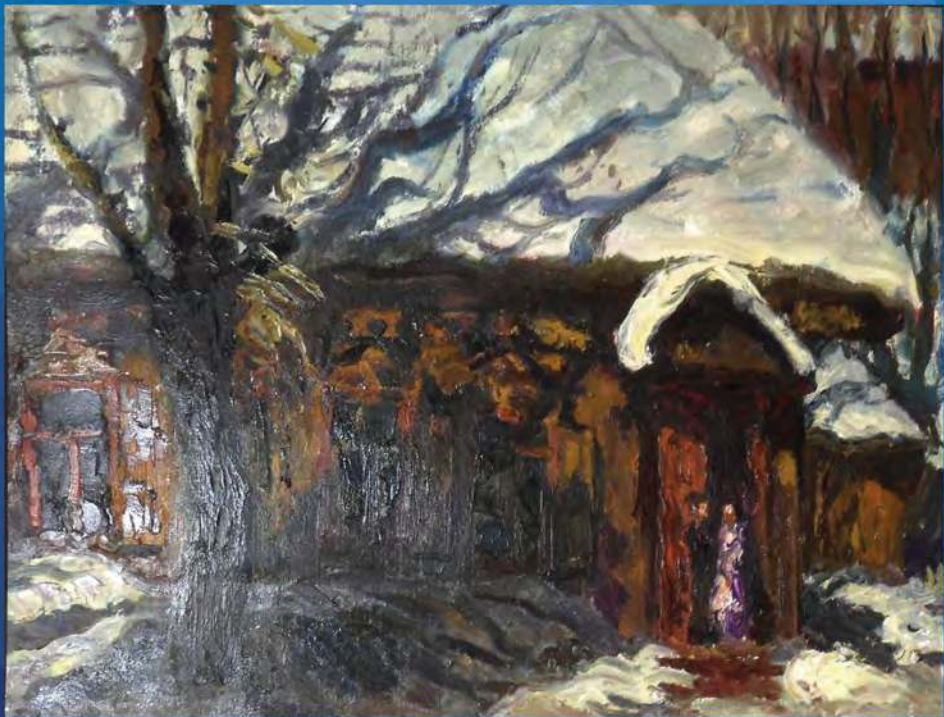
А. Рубцов. 8 марта. X., м. 1985 г.