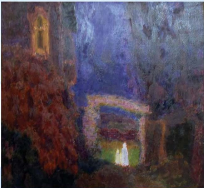
А. Рубцов. Гость. Х, м. 2010 г.