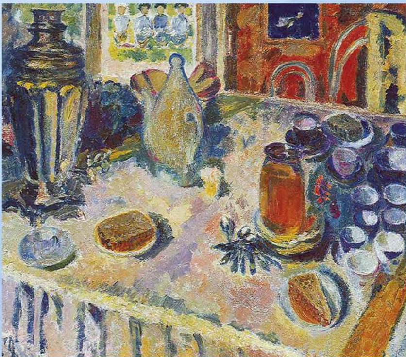
А. Рубцов. Синие чашки. Х., м., 1979 г.