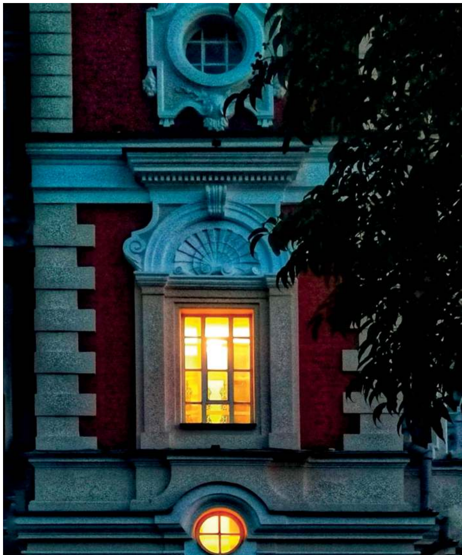
Л. Ладик. Вечер