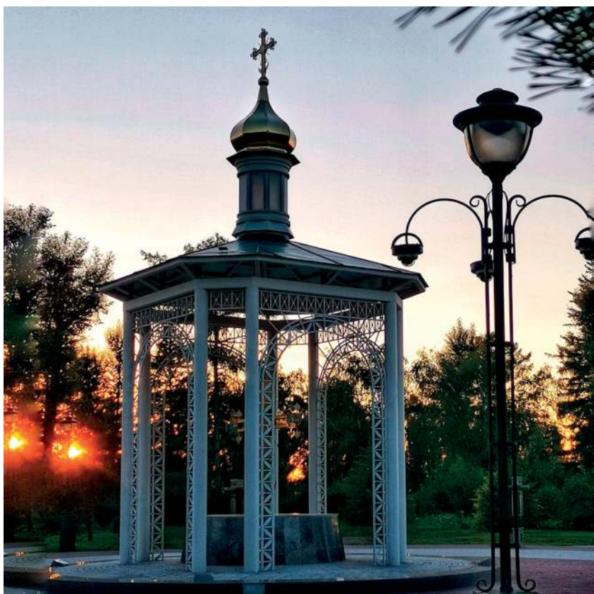
Л. Ладик. Мемориал на Иерусалимской горе