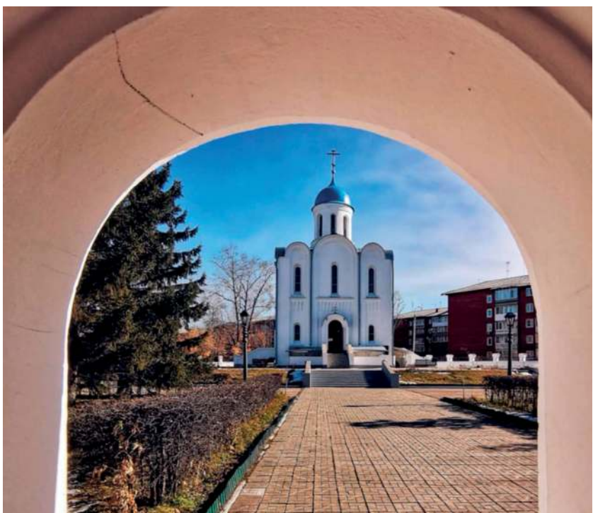
Л. Ладик. Храм Рождества Христова. Второй Иркутск