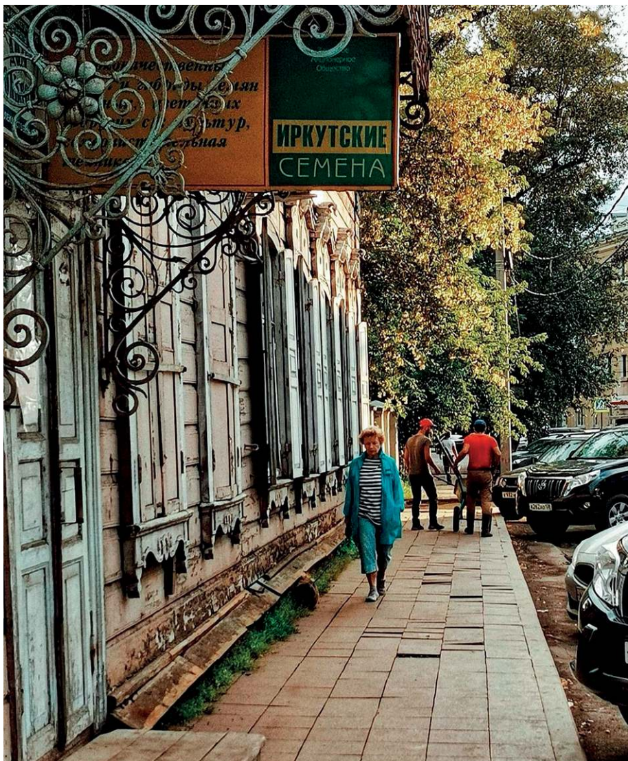
Л. Ладик. Заповедные иркутские улочки