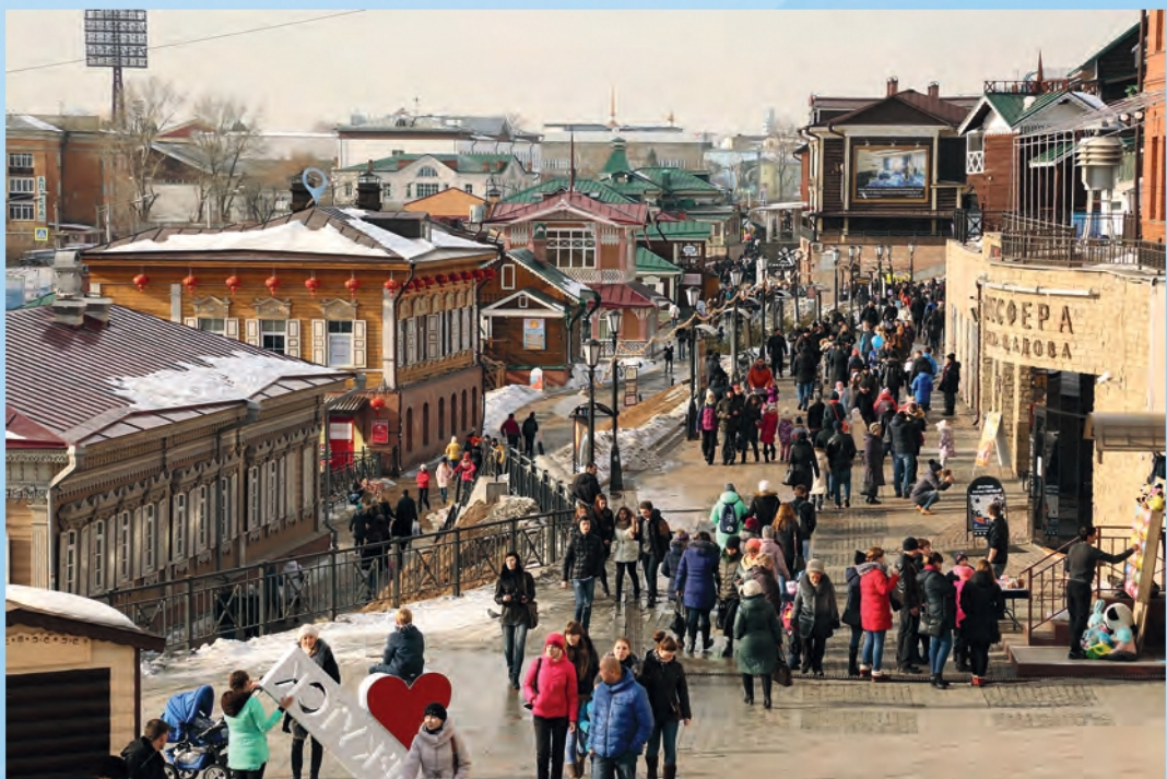
В. Гуляев. Модный квартал