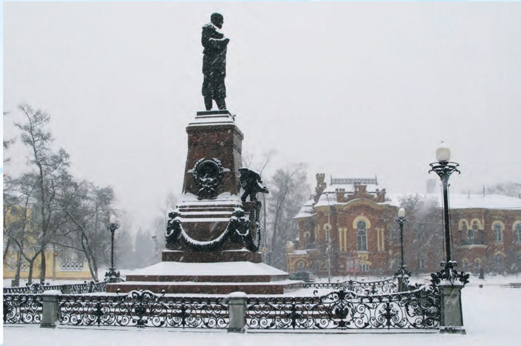
В. Гуляев. Император и краеведческий музей