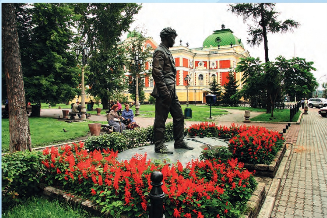
В. Гуляев. Вампилов и драмтеатр