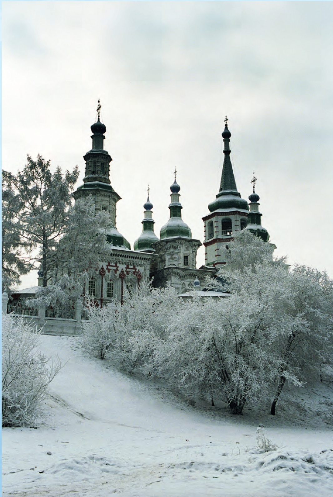
В. Гуляев. Крестовоздвиженский храм