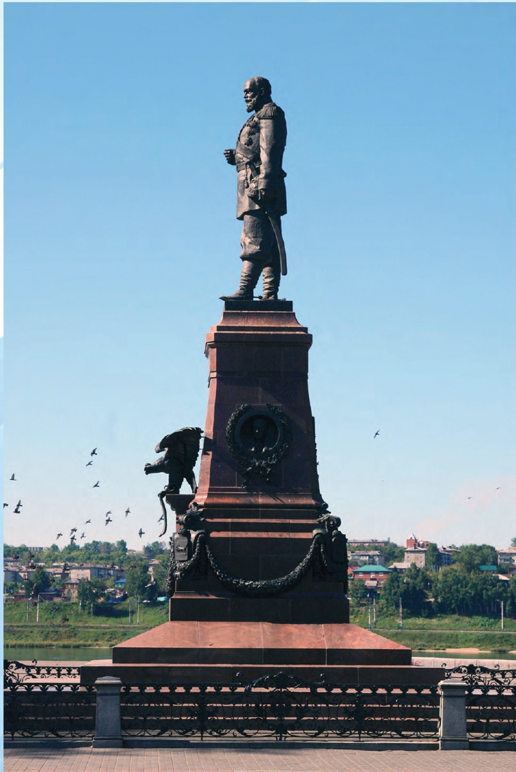
В. Гуляев. Царь Александр III в Иркутске