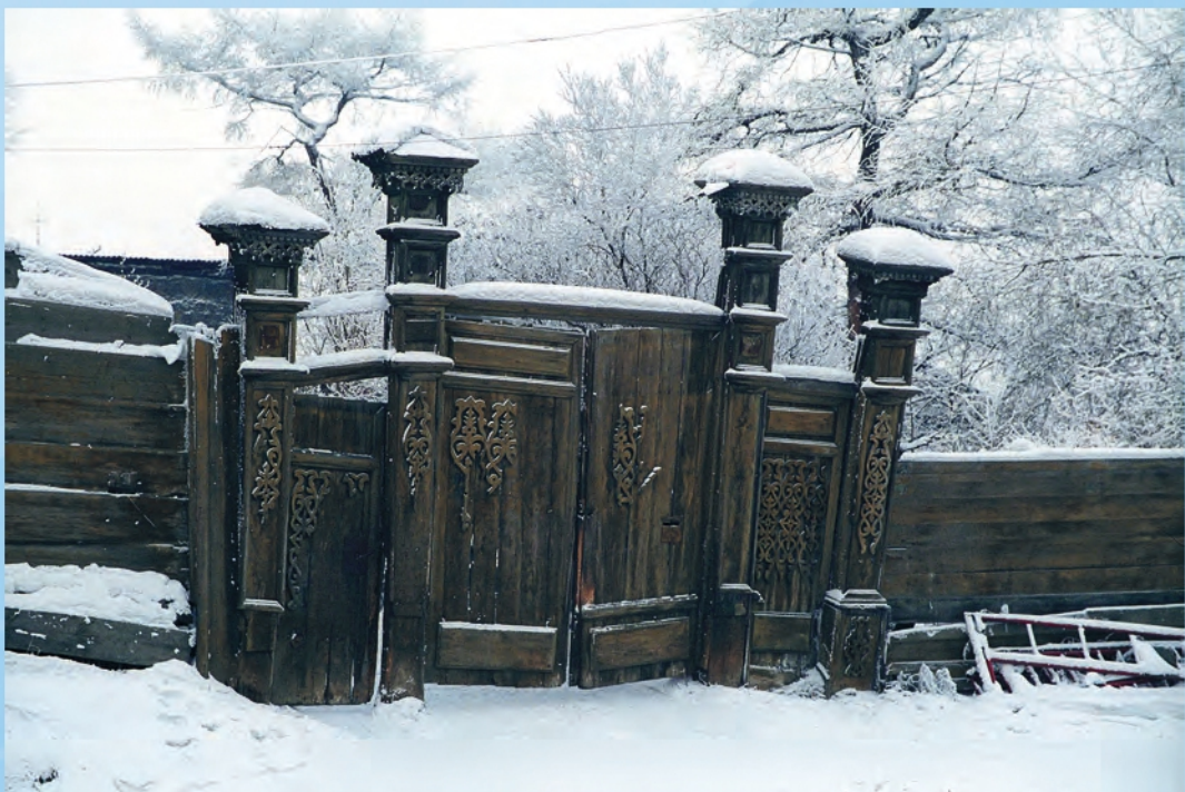
В. Гуляев. Деревянный Иркутск