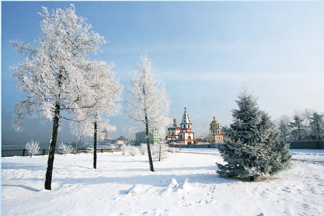
В. Гуляев. Подморозило