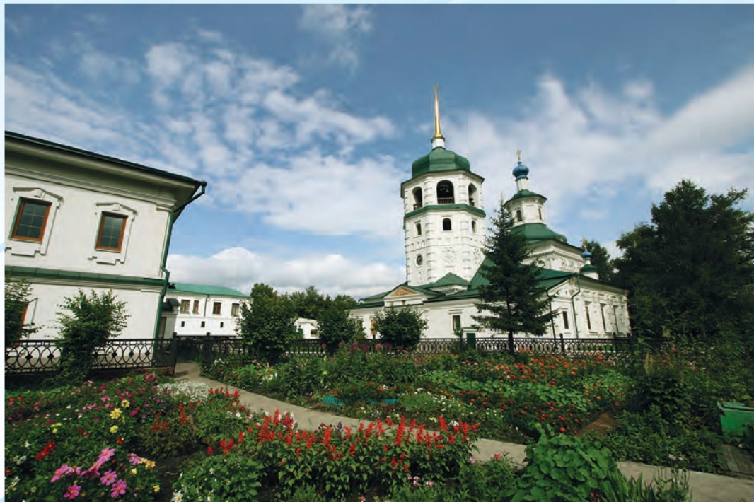
В. Гуляев. Спасский собор