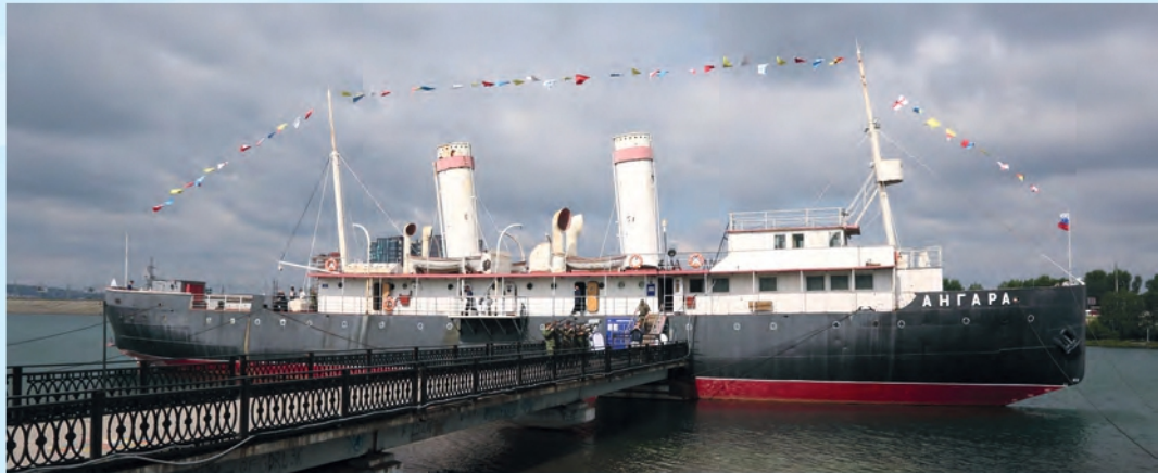
В. Гуляев. Легендарный ледокол «Ангара».