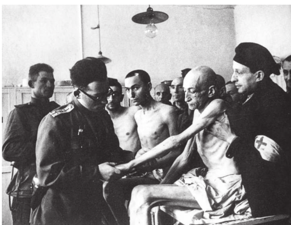
Осмотр бывших узников советскими врачами. 1945 г.