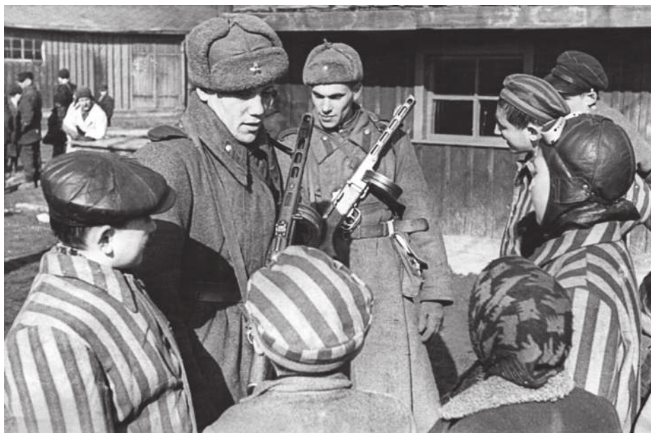
Освобожденные узники Освенцима беседуют с бойцами Красной армии. Освенцим. 1945 г.

В одном из складов натолкнулись на груды мыла, к которому никто из освобожденных не притрагивался: это мыло, приготовленное нацистами из человеческого жира. В “жилых” бараках лежат, иногда стоят истощенные, измученные,