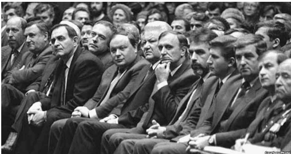
И ведь этим лицам веришь! Эх, им бы всем стать актерами! И себя бы проявили, и людям меньше вреда нанесли

— Вообще-то мы тоже знаем, кто их заказал. Они тут, кстати, среди ваших гостей на форуме.