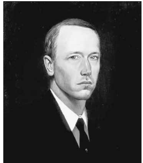
Автопортрет Константина Васильева — художника, погибшего при якобы несчастном случае еще молодым. Его музей есть в Москве на Череповецкой улице. Многие российские туристы, приехав в Москву, считают своим долгом посетить этот музей

Моя сестра, когда я посоветовал ей прочитать «Сокровища Валькирии», напомнила мне о том, как отец чуть ли не умолял меня прочитать молодого пи-