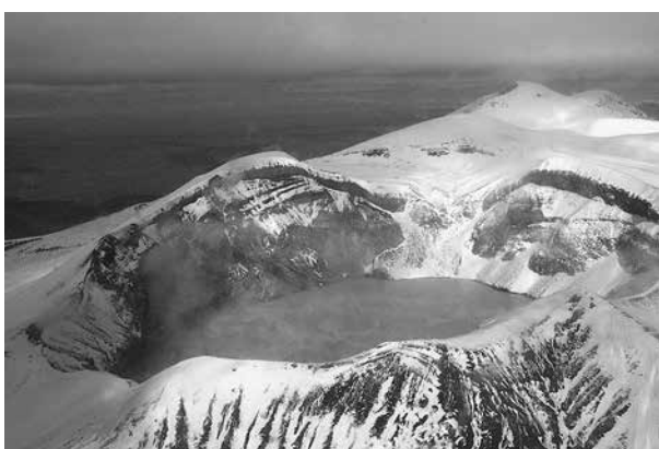
И я там был, мед пил!

Как она сюда попала? То место, где она работала спасательницей «легких планеты», — за несколько тысяч километров от Алтая. Что-то тут явно не так! Опять загадки , которые на самом деле отгадки ? «Джеймсы Бонды» лучших разведок мира и наша таежная ведьма в каком-то