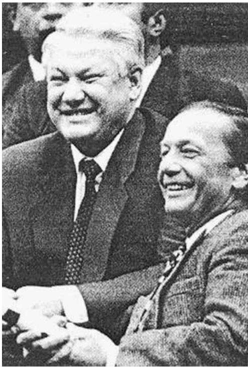
На Кубке Кремля. 1992 год

Цэрэушник даже завис на мгновение от такой моей непосредственности. Но, как положено джеймбондам , быстро с собой справился: