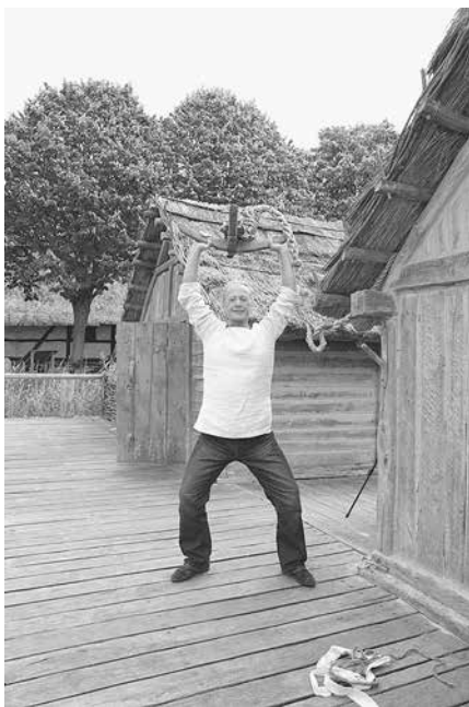
Восстановленная славянская деревня. VII–VIII века нашей эры. Германия. Провинция Померания

Здесь славяне молились своим солнечным богам! И, как показали раскопки, никогда не приносили в жертву не только людей, но и животных