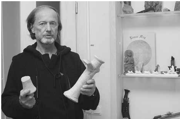
Подарки археологов, работавших на различных раскопках

Гитлер опозорил слово «ариец». Но пришло время, и мы прекрасно понимаем с вами, что история должна быть переписана. Все лучшие историки-уче-