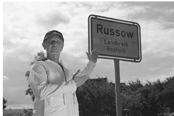
Германия. 2012 год. Поиск истоков славянорусов

небезынтересно, что деньги на эти археологические раскопки, которые производятся у вас, даем мы! Точнее, наши боковые компании. Ваших славянских правителей ничего не интересует, кроме нефти и газа, — это уже я вас цитирую, господин Задорнов.