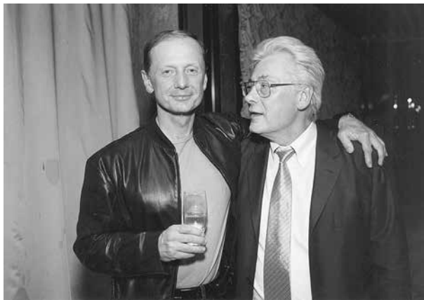
Алан Чумак и Михаил Задорнов. Где-то, когда-то после сеанса под названием «Я тебя уважаю!»

— Даже не гадайте. Наш теперешний президент где-нибудь в баньке после тенниса выпьет пивка с