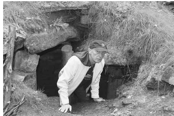
Урал. Остров Веры. Лаз в древний храм V–IV тысячелетия до нашей эры

— Вы мне в прошлый раз говорили, что я умный человек. С чего вы так круто поменяли обо мне свое мнение? Думаете, я поверю?