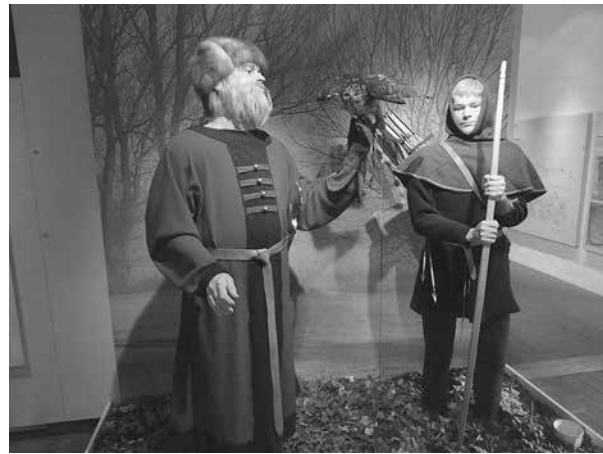
Музей при восстановленной славянской деревне на территории сегодняшней Германии. Предположительно VIII-VII века до нашей эры. Костюм местного славянина. Ну чем не новгородец?

Конечно, после этой передачи мнения телезрителей разделились. Кто был за Гордона, кто за меня. Но для тех, кому безразличен наш славянский род, это уже не имело значения. Главное — после передачи у многих молодых людей проявился нешуточный интерес к глубинной истории Руси и славян. И многие рассуждали так: раз Задорнов спокойный, несмотря на оскорбления, значит, он что-то знает. Этого я и добивался. Поэтому и согласился участвовать в бесовской передаче. Через месяца три после того, как передача вышла на Первом канале, молодая мама мне написа-