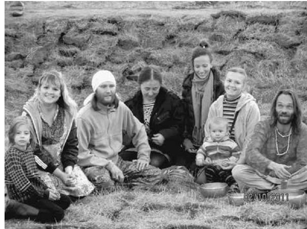
Деревня Окунево. 2012 год

И она опять была права. Я особенно начал чувствовать, что подаю надежды после того, как мне стукнуло за 50. Причем сильно стукнуло! Я бы даже сказал, больно. Болезни начались одна за другой. Практически я получил волшебный пендель. Только не знал, что в виде поцелуя через Полярную звезду. Тогда я впервые осознал, что если не буду заботиться о себе сам, то просто исчезну. Врачи меня залечат, и я уйду из жизни знаменитым никчемышем, к тому же нищим, поскольку все накопленное и заработанное за жизнь перейдет врачам.