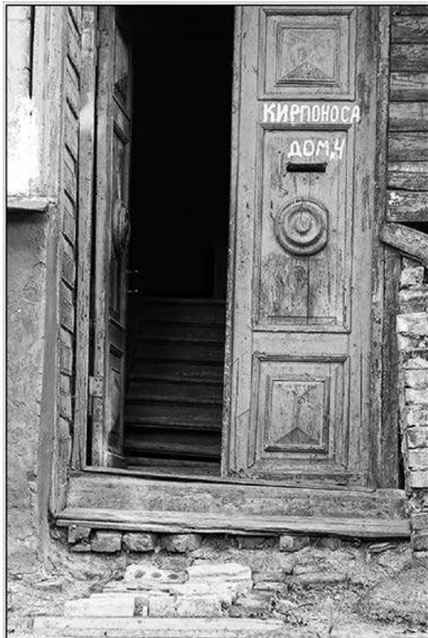
Улица старого города

Говорят, что слепая, неосознанная вера — плохо. Возможно, но только не в случае с моей сестрой. Люблю ее за то, чего у меня никогда не было и не будет, — за силу жить, любить, верить, надеяться, прощать несмотря ни на что. Я знаю немного людей, способных на такое же.