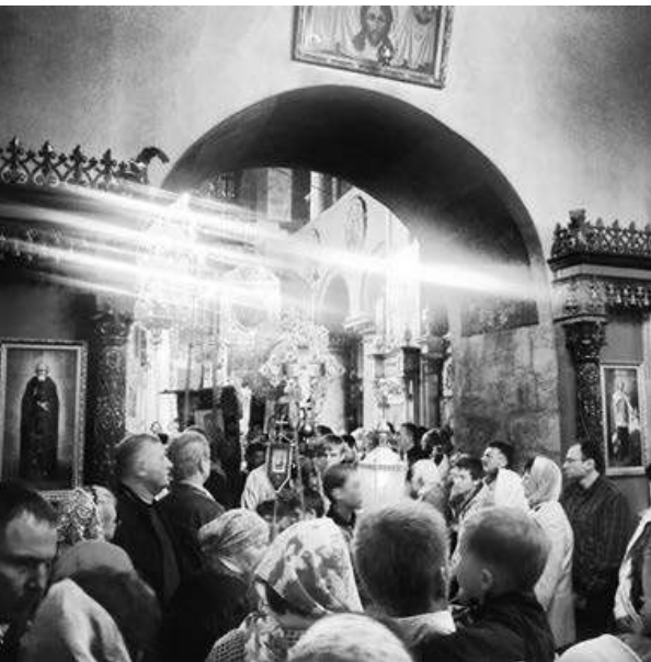
Пасха в соборе

маешь, что все мы — одна большая семья. И где-то внутри себя чувствуешь собственную причастность к чему-то очень древнему и чистому. Люблю смотреть, как причащают, как проходит само причастие. Все замирает в этот момент. Есть в этом что-то мистическое, чело-вечное и непонятное. Смотришь, и становится немного обидно и страшно... От того, что причащают не тебя, от того, что не ты сопричастен с тайной в этот момент, от того, что вдруг больше не придется увидеть это, что не успею причаститься тогда, когда захочу. Поздно будет. Люблю еще, когда в пасхальную ночь после литургии и освящения идешь домой, а над головой льется звон колоколов, лавиной заполняя все твое естество. Все внутри разрывается от радости и слез. Хочется всем тогда сказать: «Христос Воскресе!» И совершенно все равно, кому. Потому что это радость великая. Еще люблю, когда все трижды целуются.