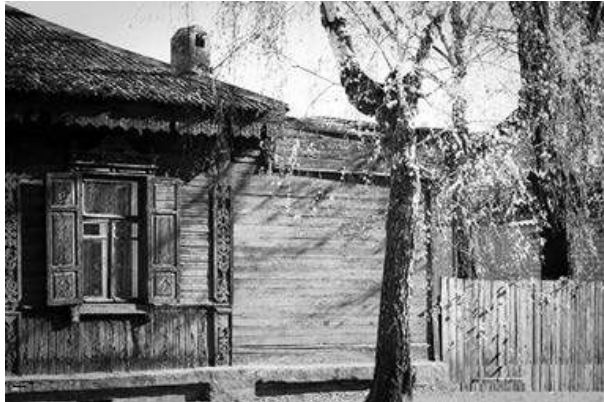
Улица старого города

Люблю весну. Когда все тает и в воздухе пахнет жизнью — все говорят, что пахнет весной. Люблю смотреть на людей, попавших под дождь, но только летний и теплый. Они радуются и ворчат одновременно. Под