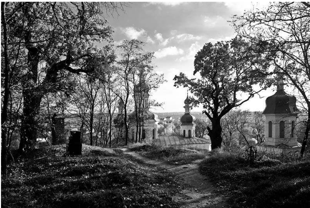
Вид на старый Чернигов