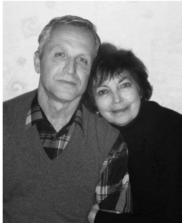
Мама и папа

Люблю, когда к нам в гости забредают старые друзья и интересные люди. Люблю, когда они, сидя с нами за столом, выпивают, закусывают, пьют чай с чем-нибудь