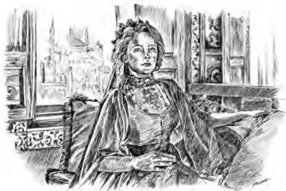
Иллюстрация к сборнику стихов Омара Хайяма

Я как иллюстратор, рисуя иллюстрации для книг, помогаю понять читателю содержание того или ино-