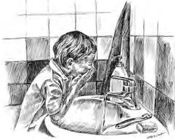
Иллюстрация к сборнику стихов Эдуарда Успенского