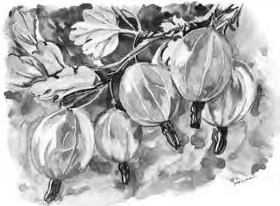
Иллюстрация для журнала «Питомник и частный сад»

Мой творческий путь заставил меня поучаствовать во многом. Я расписывала матрешек и деревянные футляры в ДК имени А. А. Вермишева г. Петергофа, рисовала стенгазеты для математико-механического факультета Санкт-Петербургского государственного университета Петергофа, преподавала в средней общеобразовательной школе «Золотое крыльцо» Петергофа, работала с несколькими журналами по садоводству, создавая для них иллюстрации (один из них — «Питомник и частный сад»).