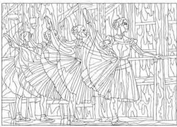
Иллюстрация к антистресс-раскраске для взрослых на тему «Импрессионизм»

«Ваш учитель — это природа», — говорил М. Карваджо, итальянский художник. Я также стараюсь вдохновляться от природы, от окружающего мира. Я рисую, для того чтобы быть счастливой.