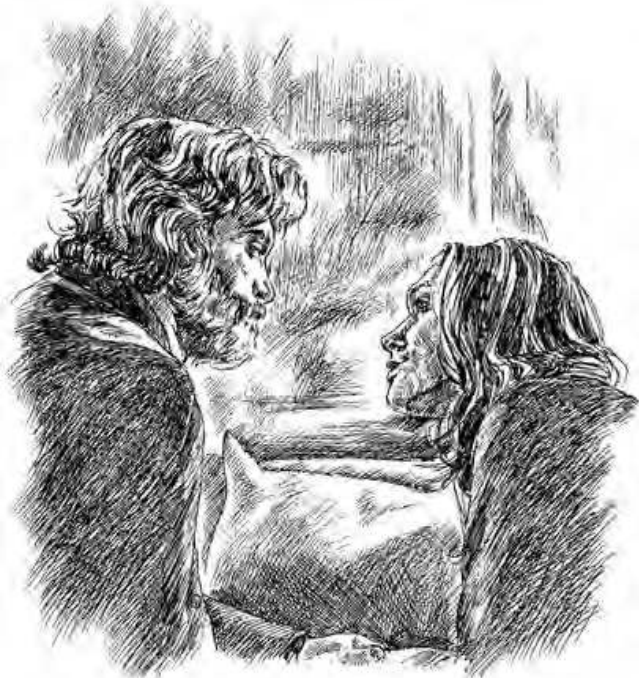
Иллюстрация к книге Донато Карризи «Девушка в тумане»

Художник — это не профессия, это призвание. Я вижу красоту и стараюсь создавать ее в своих работах. Все это кажется очень сложным, но в то же время таким простым. Если уделять этому достаточно сил, то все получится. Это я и делаю в своих работах.