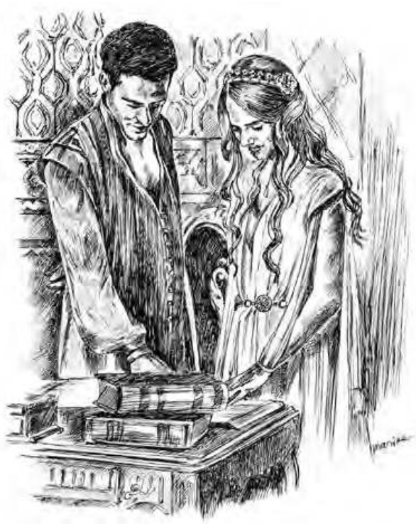
Иллюстрация к сборнику стихов Омара Хайяма

Иногда нет времени и сил после рабочего дня, и все же, несмотря на все преграды, я беру карандаш. Я рисую в блокноте, который всегда могу взять с собой.