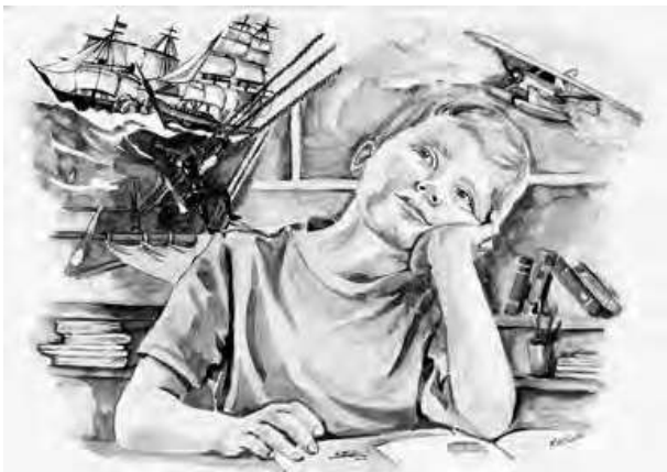
Иллюстрация к сборнику стихов Агнии Барто

го произведения, лучше представить себе героев, их внешность, характер, поступки, обстановку, в которой они живут. По иллюстрации, которую я создаю, можно догадаться, даже не прочитав произведение, злые герои или добрые, умные или глупые.