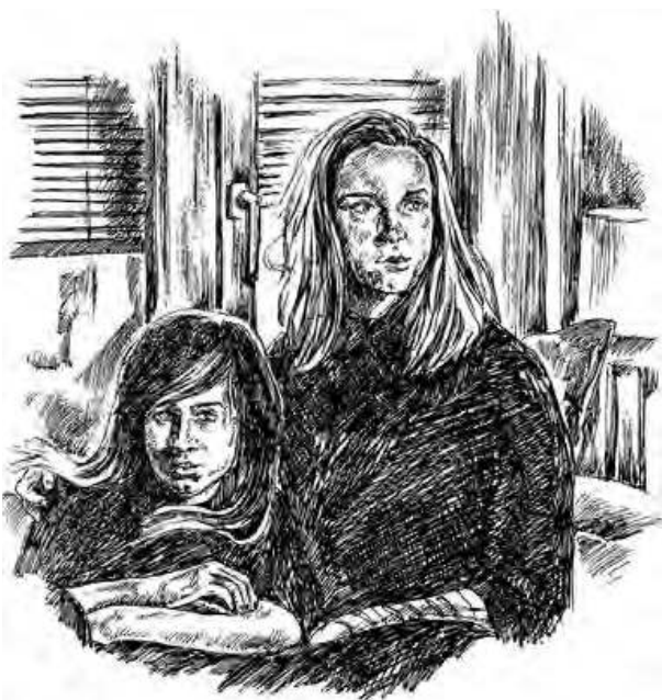
Иллюстрация к книге Донато Карризи «Девушка в тумане»

Как любой художник, я всегда устремлена в будущее, даже если темами моих работ становятся исторические сюжеты. И моя увлеченность неиссякаема.