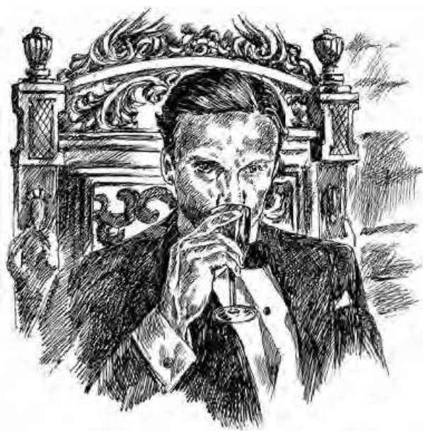
Иллюстрация к книге Дафны Дюморье «Ребекка»

Я благодарна судьбе за то, что она дала мне возможность творить, общаться с единомышленниками, открывать в себе новые грани и возможности, удивлять себя и других. Творчество помогает окунуться в мир фантазий, забыть хоть на миг о бесконечном хаосе, су-