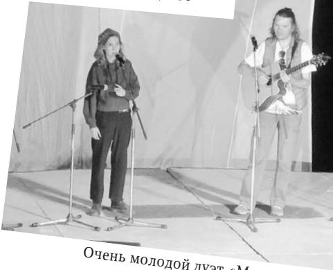
Очень молодой дуэт «Мезозой»