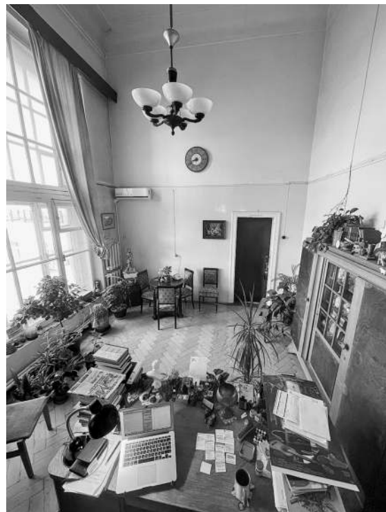
↑ Кабинет директора. 10-й этаж

ресторанный подвальчик в Италии, куда захаживали еще современники Цезаря.