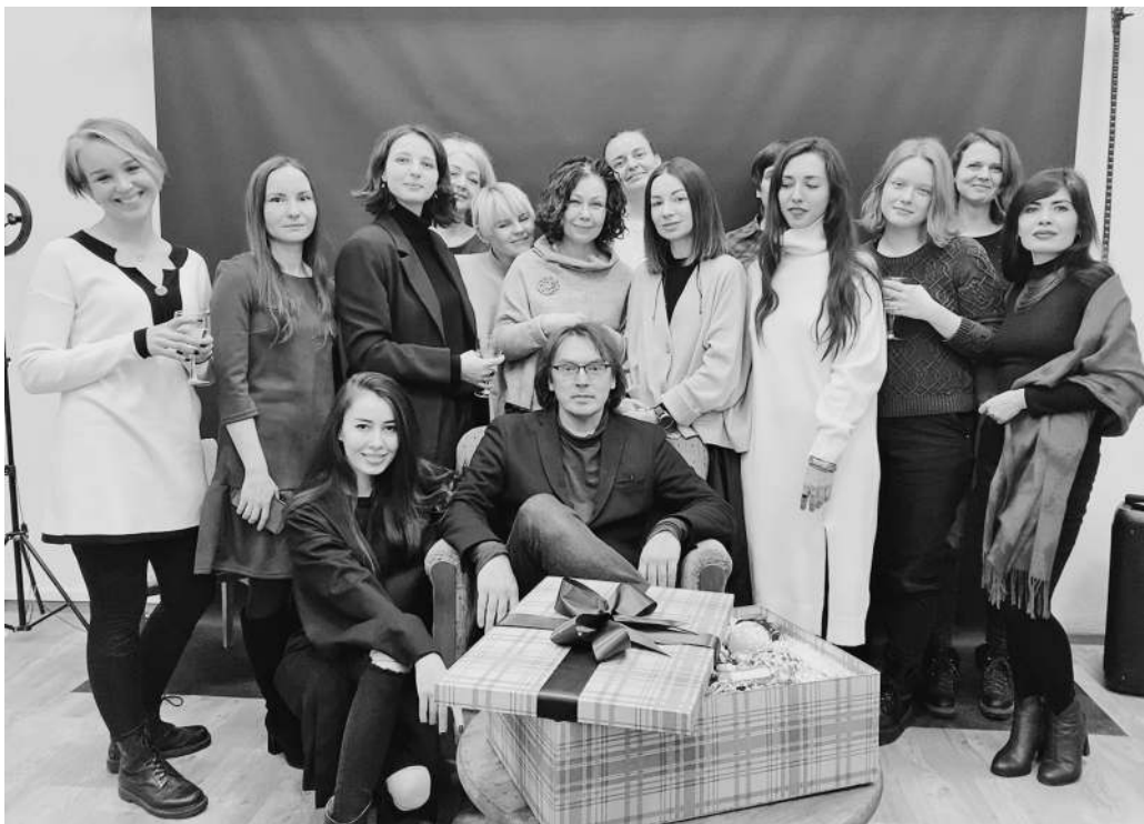
† Семинар поэзии Д. Воденнинова. Школа «Пишем на крыше»

Год 2022-й. За 65 лет – 8,5 миллионов экземпляров совокупного тиража журнала и более 15 тысяч публикаций.