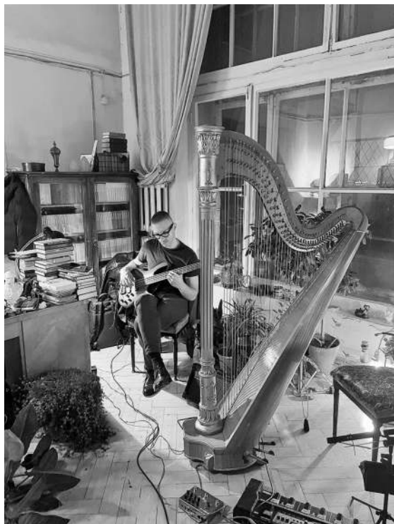
↑ «Вспоминается и масштабная вечеринка в стиле Гэтсби — с арфой, бас-гитарой, сансофоном и человеком в малиновом тринго...»