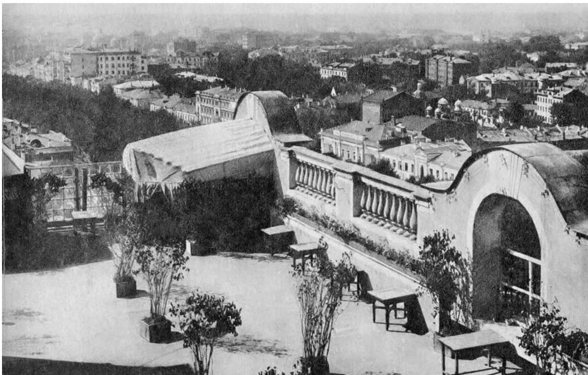
↑ Ресторан «Крыша». 1925 год

миф, и одновременно пугающий, этот дом и был московским «Титаником»; при взгляде снизу казалось, что он едва замечает беспокойный город. Плоская двухъярусная крыша его, возвышавшаяся, словно палуба, над старушкой-Москвой – полугородом-полудеревней, и видная на многие километры, сама по себе вызывала сравнение с кораблем у посещавших ее, а для военных – соответственно, без всякой лирики, – это была стратегическая высота.