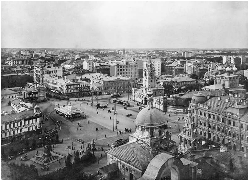
↑ Панорама, открывающаяся с дома Нирнзее, вид на Страстную (ныне Пушкинскую) площадь. 1915–1916 годы

поднялся проветриться – покурить, выпить вина или пива, съесть бутерброд и неожиданно придумать финал «Дьяволиады», герой которой попадает на ту же Крышу. Но чуть раньше «Дьяволиады» Булгаков писал о Крыше в «Сорока сороках», где даже указал месяц и год ее посещения – апрель 1922-го, то есть ровно сто лет назад. Наконец, в доме случилась судьбоносная встреча писателя со своей третьей женой Еленой Шиловской, ставшей прототипом Маргариты.