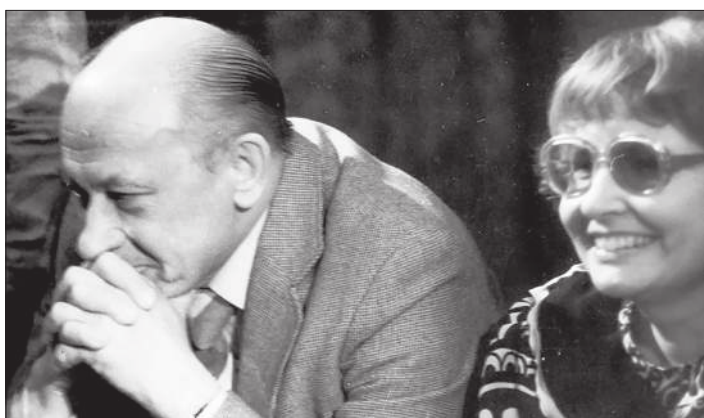
1987 год. Идут государственные экзамены

А чтобы сохранить русскую речь с её прекрасными возможностями, необходимо организовать при училище совместно с Нижегородской телерадиокомпанией Речевой центр, который должен будет заниматься разными речевыми проблемами, среди которых одна из приоритетных – сохранение русского языка – русской речи.