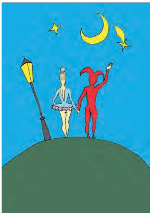
принцесса и шут