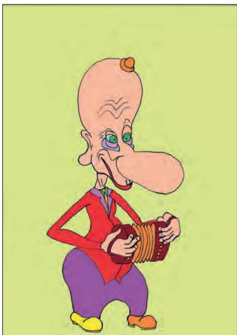
шенсонье с гормошкой