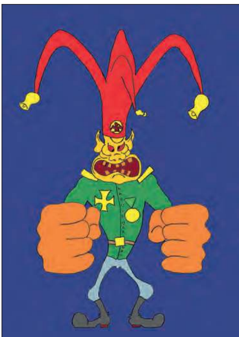
шут яростный хам