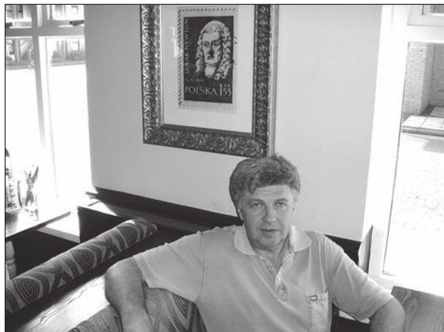
В баре Исаака Ньютона. На стене — литография страницы из «Математических начал натуральной философии»